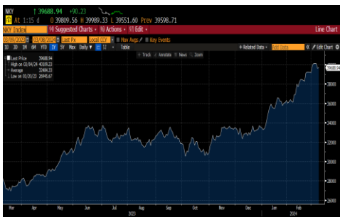
Índice accionario Nikkei (JPN)