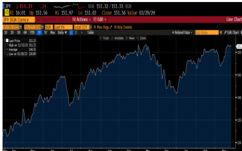
Yen Japonés (JPN)